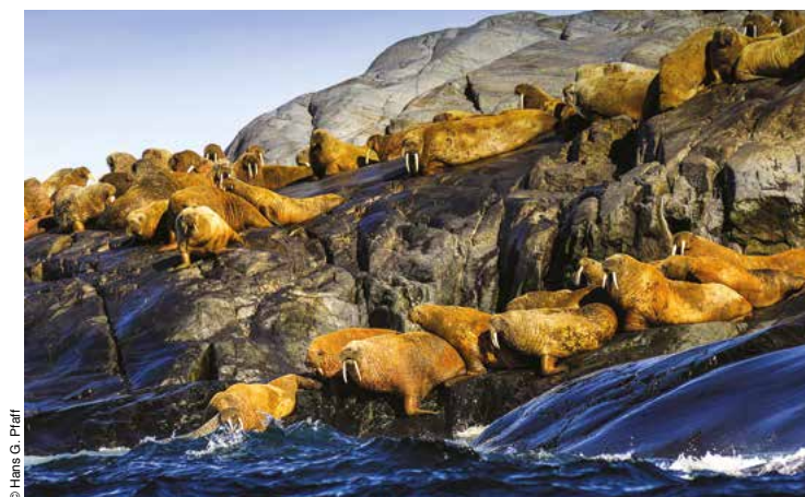
Colonie de morses.