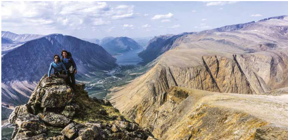
Les monts Torngat vus du parc national Kuururjuaq.