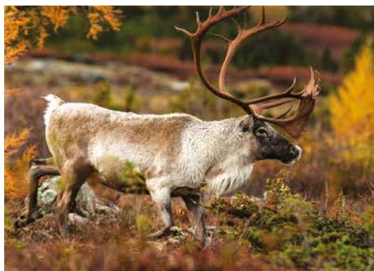
Emblème du Canada, le caribou a du panache.