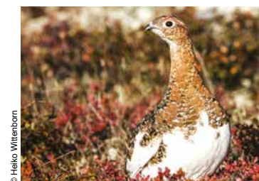
Lagopède (perdrix des neiges).