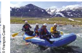
Rafting sur la rivière Koroc.