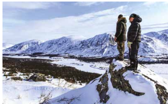
Vallée de la rivière Koroc du parc national Kuururjuaq en hiver.