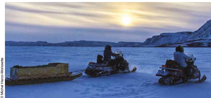
Motoneiges dans le parc national Tursujuq.