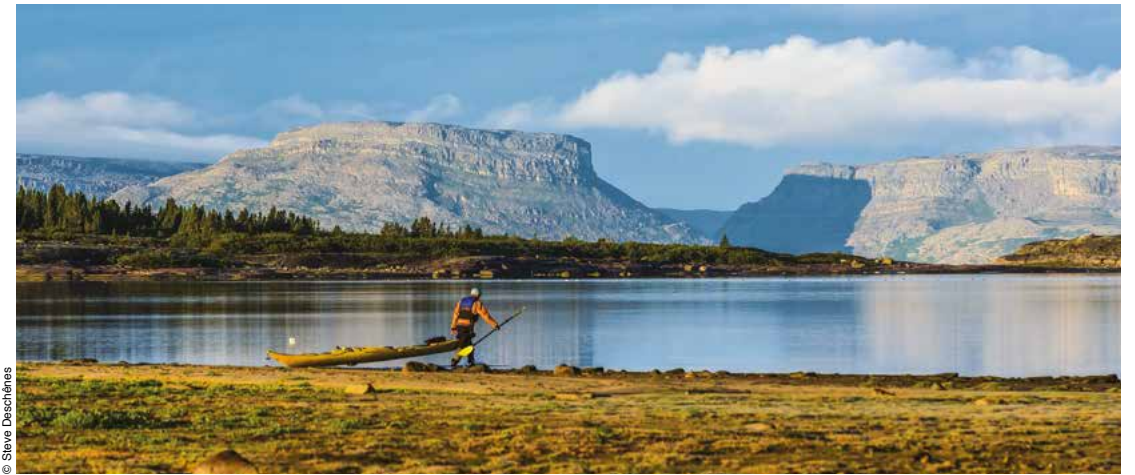
Les cuestas hudsoniennes du parc national Tursujuq.

Plus d'infos: www.nunavikparks.ca/fr/parcs/kuururjuaq