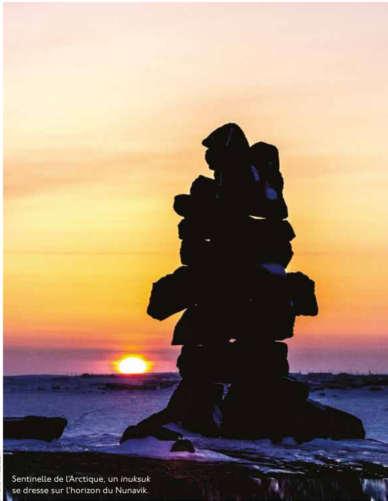
Sentinelle de l'Arctique, un inuksuk se dresse sur l'horizon du Nunavik.