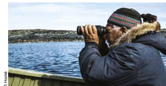
Guide inuk à l'affût.