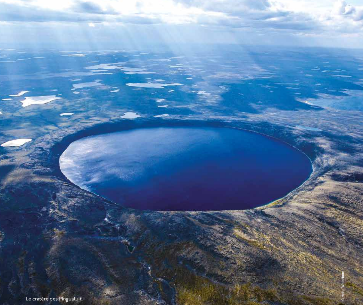
Le cratère des Pinguicuit.