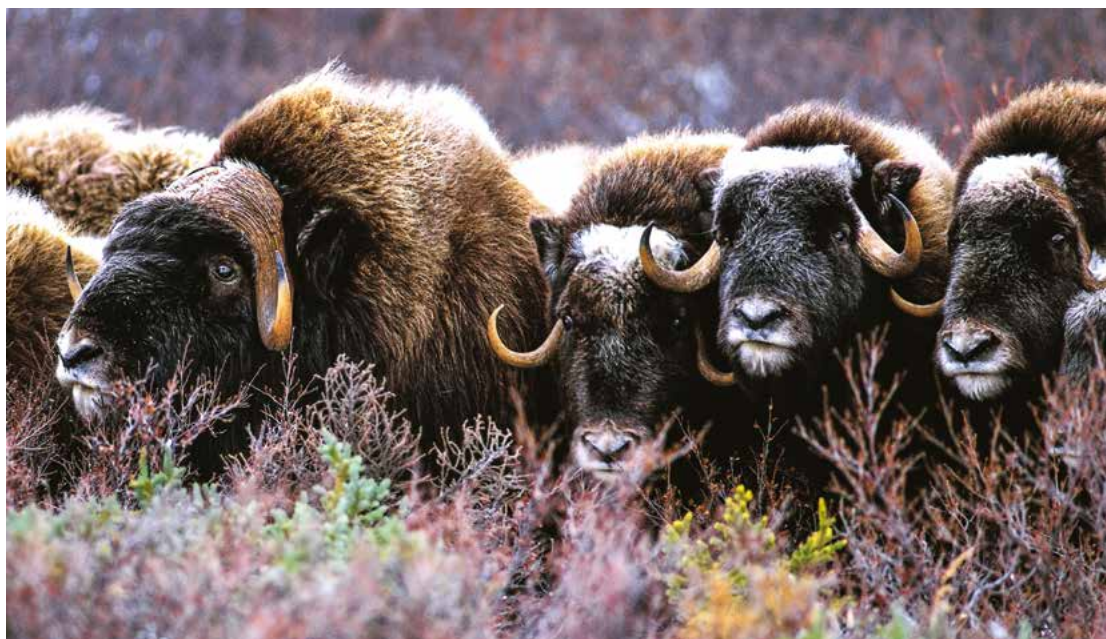
Bœufs musqués, tirés tout droit de la préhistoire.