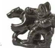
Sculpture par Lucassie Echallook.

Pratiqués par les femmes inuites, les chants de gorge – katajjaq en inuktitut – imitent les sons de la nature, des oiseaux et des animaux grâce à une surprenante technique vocale. À l'origine, il s'agissait d'un jeu opposant deux femmes se tenant debout l'une face à l'autre. La première qui riait avait perdu ! Aujourd'hui encore la tradition perdue et ces fascinants duos sont l'occasion de soirées mémorables.