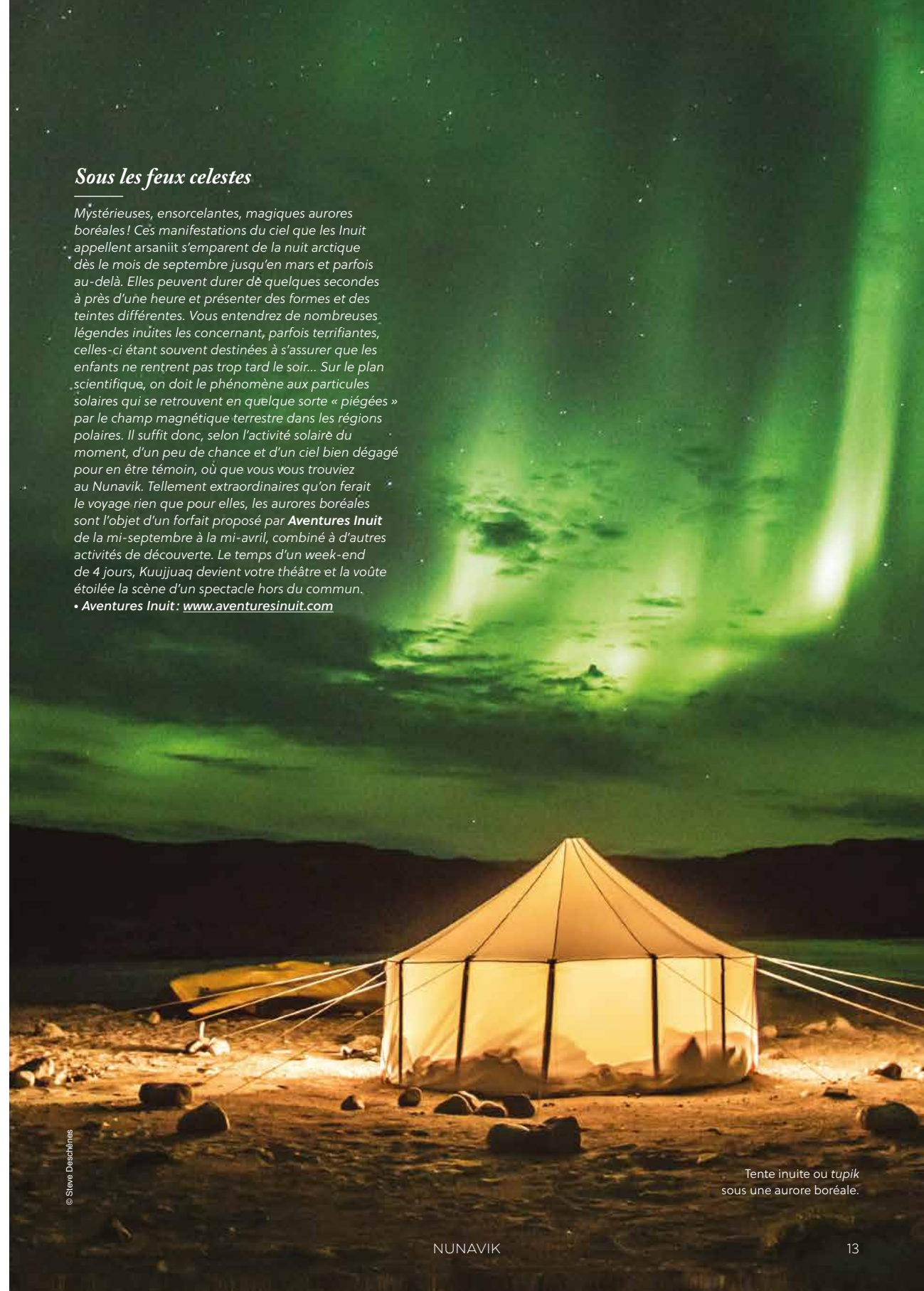
Tente inuite ou tupik sous une aurore boréale.

• Aventures Inuit : www.aventuresinuit.com