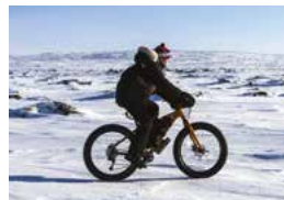
Fat bike au cœur de l'hiver.