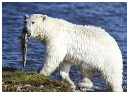
L'ours blanc, un pêcheur redoutable.