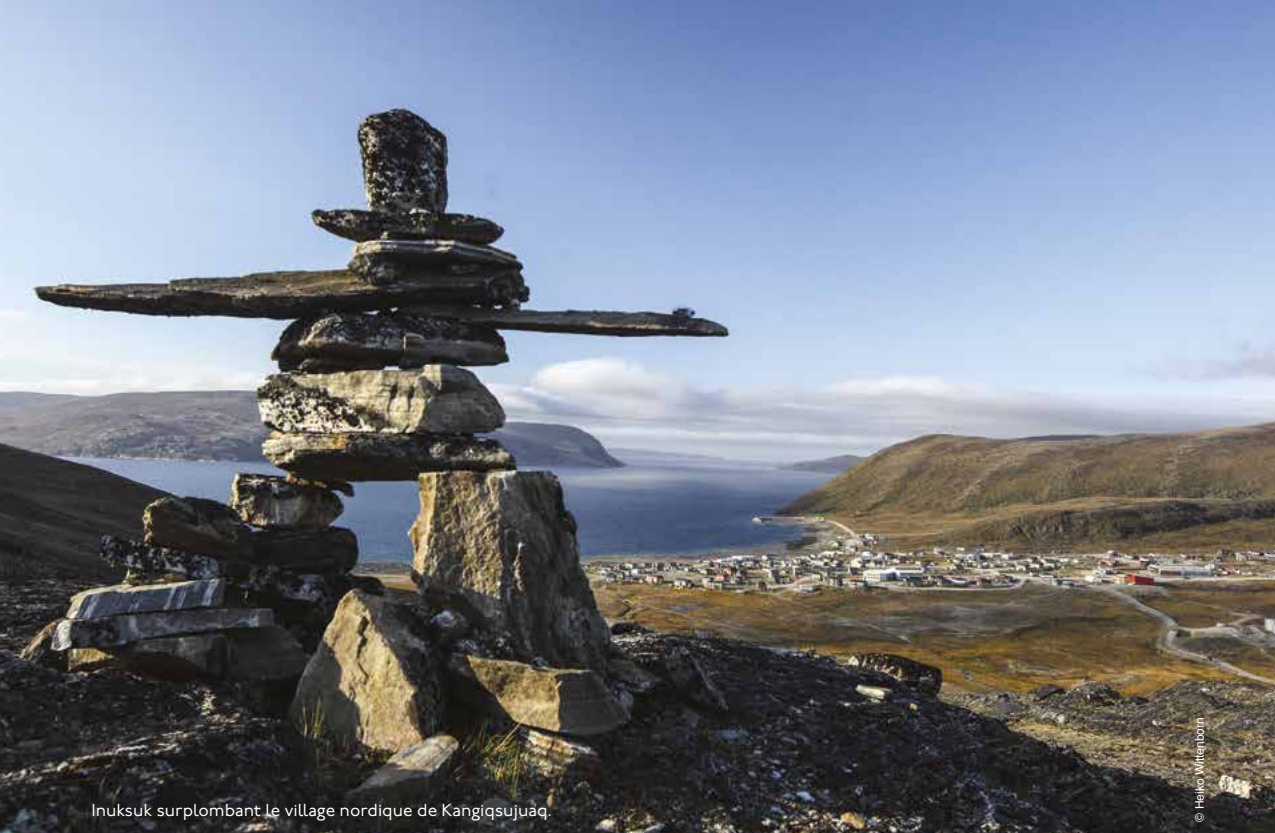
Inuksuk surplombant le village nordique de Kangiqsujuaq.