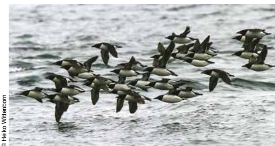
Guillemots de Brunnich.

nombreux aujourd'hui, leur migration n'en est pas moins fascinante à observer. Notre troisième souverain de la tundra n'a pas seulement l'apparence d'un animal des temps préhistoriques: les bœufs musqués ( umimait , soit les barbus) furent bel et bien des contemporains des mammoths! Originaires des steppes du nord de l'Asie qu'ils arpentaient à leur côté il y a un million d'années, ils gagnèrent l'Amérique du Nord via le détroit de Béring il y a plus de 90000 ans mais ne furent réintroduits au Nunavik que bien plus récemment, au XX e siècle. La tundra semble leur réussir à merveille puisqu'on compte maintenant pas moins de 2 000 individus dans la région.