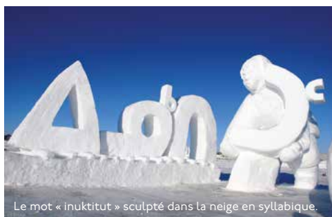
Le mot « inuktitut » sculpté dans la neige en syllabique.