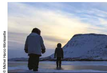
Des paysages transfigurés en hiver.