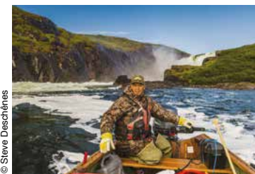
Près de la chute Nastapoka.

Et de quatre! Le parc national Ulittaniujalik offrira bientôt lui aussi une myriade d'activités de plein air – dont des escapades en canot-camping –, de rencontres avec la faune et de découvertes culturelles. Le vaste plateau de la rivière George, la rivière Ford et le mont Pyramide, qui coiffe l'horizon de ce tout nouvel écrin, sont les merveilles naturelles protégées par ce quatrième membre du réseau de Parcs Nunavik . Un dernier né qui se porte plutôt bien, puisque ses 5 293 km 2 en font le deuxième plus grand parc national au Québec, après son grand frère Tursujuq.